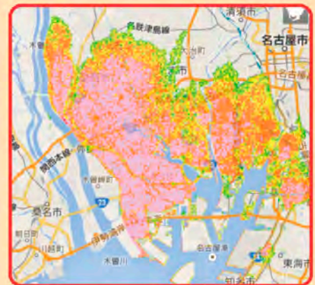
愛知県防災学習システム 防災マップから抜粋

家族で、津波・高潮などに備え、緊急避難場所を確認しておきましょう。また、職場での防災についても考えましょう。