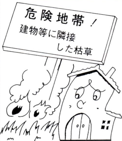
管内町村別枯草指導件数