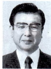
海部南部消防組合