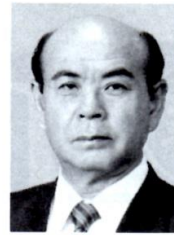
海部南部消防組合