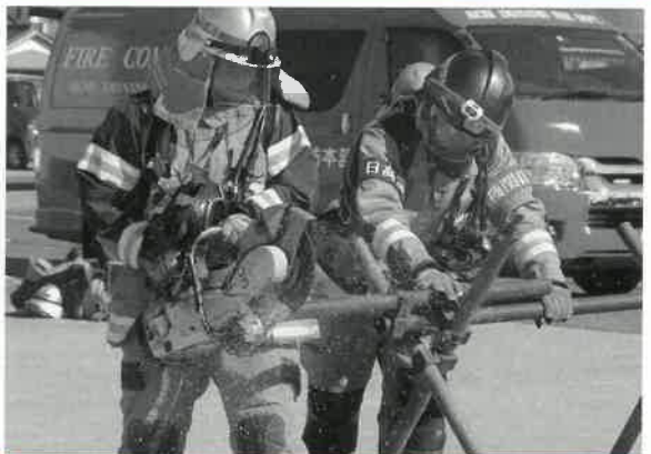
エンジンカッターによる障害物の除去